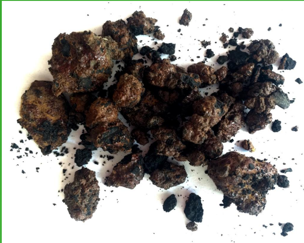
Образец замасленной окалины

Научно-экспериментально доказано, что полная очистка окалины от масляных загрязнений возможна только при испарении масла. Данные исследования подтверждены Протоколом по результатам проведения лабораторных испытаний по очистке окалины от масляных загрязнений от 21.11.2011 года.