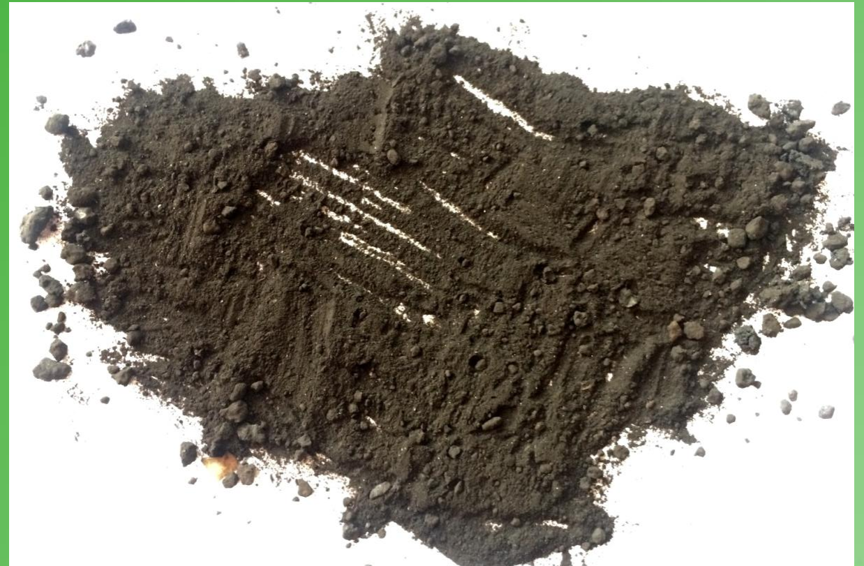
Образец очищенной окалины методом выпаривания